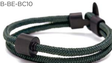
CORD NATO GRÜN TB-BE-BC10