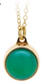
GOLDENE ANHÄNGER GRÜNER ACHAT TB-PG-AGG