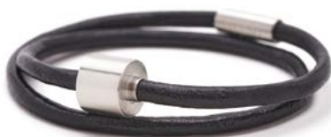
GLATTLIEDER SCHWARZ TB-BL1