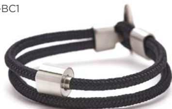
CORD SCHWARZ TB-BC1