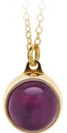
GOLDENE ANHÄNGER AMETHYST TB-PG-AMT