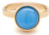
GOLDENE RINGE BLAUER ACHAT TB-RG-AGB