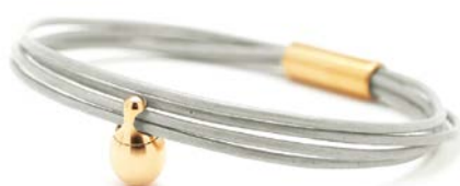
CHARM ARMBAND PERLE TB-CLG10