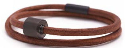
GLATTLIEDER COGNAC TB-BE-BL3