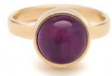
GOLDENE RINGE AMETHYST TB-RG-AMT