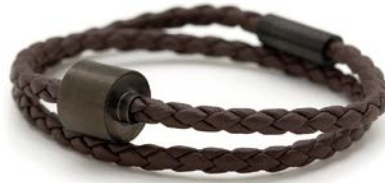
GEFLOCHTENES LEDER BRAUN TB-BE-BB2