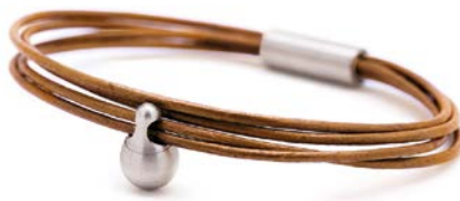
CHARM ARMBAND COGNAC TB-CL3