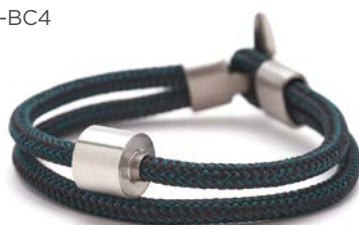
CORD SCHWARZ & PETROL TB-BC4