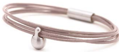
CHARM ARMBAND AUSTER TB-CL13