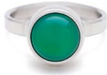
STAHLRING GRÜNER ACHAT TB-RS-AGG