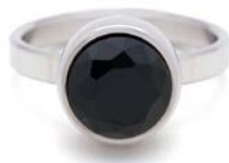
STAHLRING SCHWARZER ONYX FACET TB-RS-ONB-FC