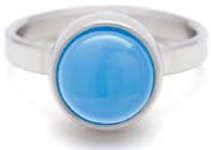
STAHLRING BLAUER ACHAT TB-RS-AGB