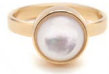
GOLDENE RINGE PERLMUTT TB-RG-MOP