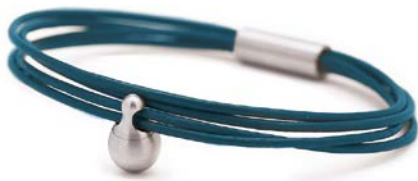
CHARM ARMBAND PETROL TB-CL9