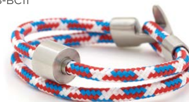
CORD TOMMY TB-BC11