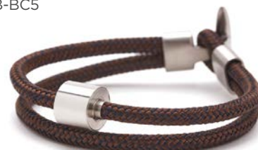
CORD BRAUN & MARINEBLAU TB-BC5