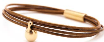
CHARM ARMBAND COGNAC TB-CLG3