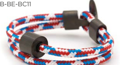
CORD TOMMY TB-BE-BC11