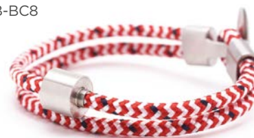
CORD ROT & WEISS TB-BC8