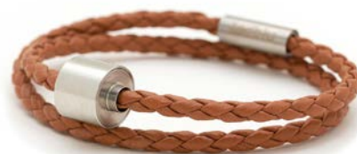
GEFLOCHTENES LEDER COGNAC TB-BB3