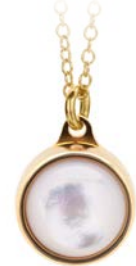
GOLDENE ANHÄNGER PERLMUTT TB-PG-MOP