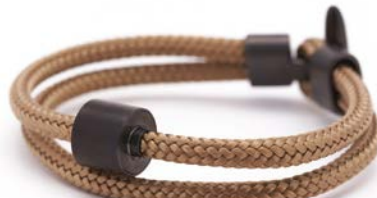
CORD GOLDSAND TB-BE-BC7