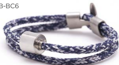
CORD JEANS TB-BC6