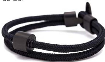
CORD SCHWARZ TB-BE-BC1