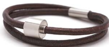
GLATTLIEDER BRAUN TB-BL2