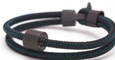
CORD SCHWARZ & PETROL TB-BE-BC4