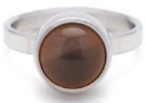
STAHLRING GRAUER MONDSTEIN TB-RS-MOG