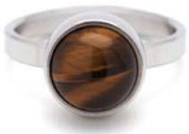
STAHLRING TIGERAUGE TB-RS-TEY