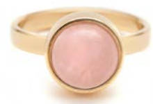
GOLDENE RINGE ROSENQUARZ TB-RG-ROQ