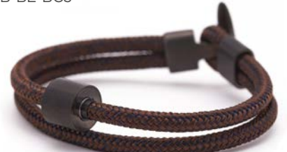
CORD BRAUN & MARINEBLAU TB-BE-BC5