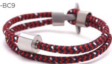
CORD ROT & SCHWARZ TB-BC9