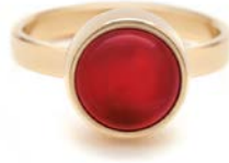
GOLDENE RINGE ROTHER ACHAT TB-RG-AGR