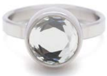
STAHLRING KRISTALL FACET TB-RS-CRY-FC