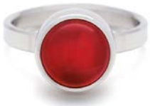
STAHLRING ROTHER ACHAT TB-RS-AGR