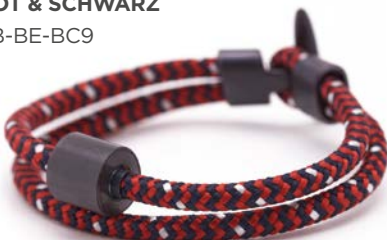
CORD ROT & SCHWARZ TB-BE-BC9