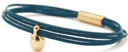
CHARM ARMBAND PETROL TB-CLG9