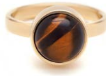
GOLDENE RINGE TIGERAUGE TB-RG-TEY