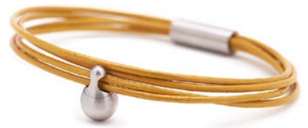
CHARM ARMBAND GELB TB-CL8