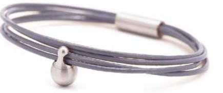
CHARM ARMBAND GRAU TB-CL14