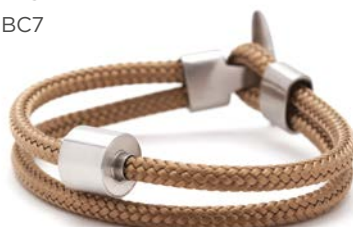
CORD GOLDSAND TB-BC7