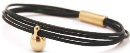
CHARM ARMBAND SCHWARZ TB-CLG1