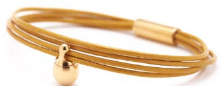
CHARM ARMBAND GELB TB-CLG8