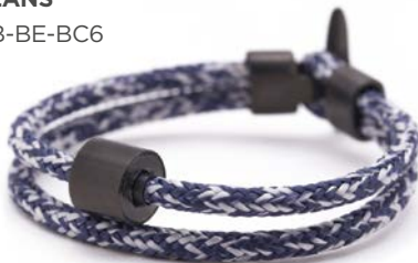
CORD JEANS TB-BE-BC6