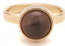
GOLDENE RINGE GRAUER MONDSTEIN TB-RG-MOG