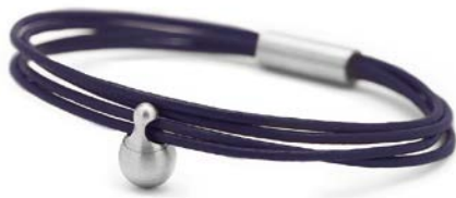
CHARM ARMBAND DUNKELBLAU TB-CL12