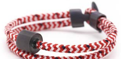
CORD ROT & WEISS TB-BE-BC8