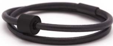
GLATTLIEDER SCHWARZ TB-BE-BL1