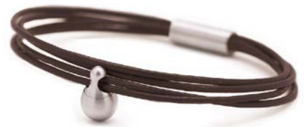
CHARM ARMBAND BRONZE TB-CL11