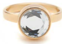
GOLDENE RINGE KRISTALL FACET TB-RG-CRY-FC