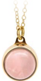
GOLDENE ANHÄNGER ROSENQUARZ TB-PG-ROQ