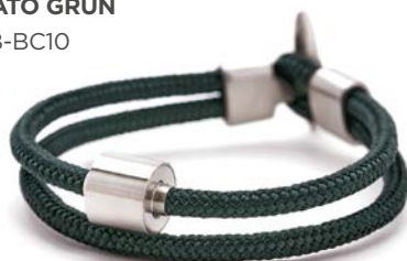
CORD NATO GRÜN TB-BC10