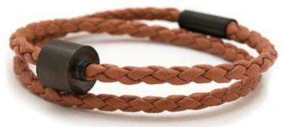
GEFLOCHTENES LEDER COGNAC TB-BE-BB3