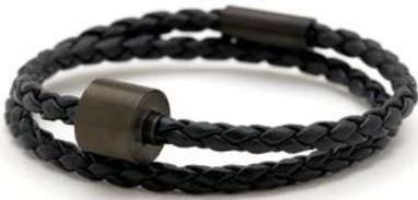
GEFLOCHTENES LEDER SCHWARZ TB-BE-BB1