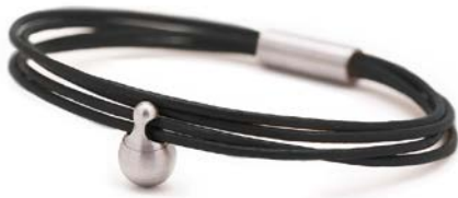
CHARM ARMBAND SCHWARZ TB-CL1