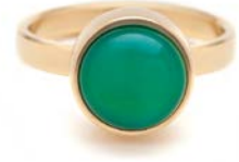
GOLDENE RINGE GRÜNER ACHAT TB-RG-AGG