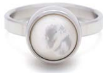
STAHLRING PERLMUTT TB-RS-MOP