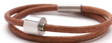
GLATTLIEDER COGNAC TB-BL3