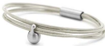
CHARM ARMBAND PERLE TB-CL10