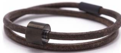
GLATTLIEDER BRAUN TB-BE-BL2