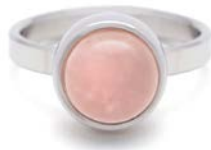
STAHLRING ROSENQUARZ TB-RS-ROQ