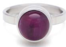
STAHLRING AMETHYST TB-RS-AMT