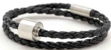
GEFLOCHTENES LEDER SCHWARZ TB-BB1