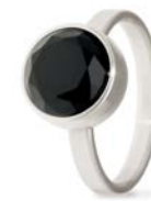
Ring Edelstahl Schwarzer Onyx Facettiert TB-RS-ONB-FC