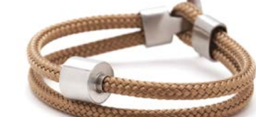
Nautisches Seil Goldsand TB-BC7