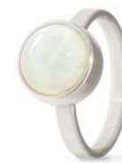
Ring Edelstahl Perlmutter TB-RS-MOP