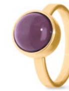
Ring Gold Amethyst TB-RG-AMT