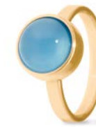
Ring Gold Blauer Achat TB-RG-AGB