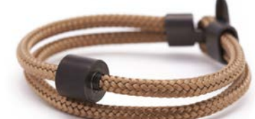
Nautisches Seil Goldsand TB-BE-BC7