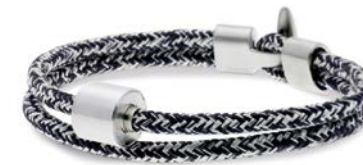
Nautisches Seil Jeans TB-BC6