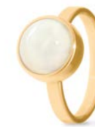
Ring Gold Perlmutter TB-RG-MOP