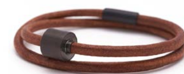
Glattes Leder Cognac TB-BE-BL3