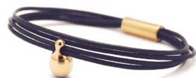
Charm-Armband Gold Dunkelblau TB-CLG12