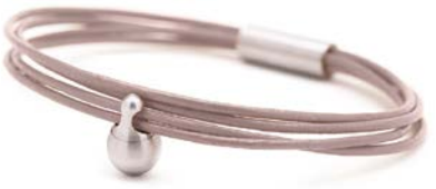
Charm-Armband Edelstahl Auster TB-CL13