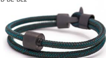
Nautisches Seil Schwarz & Petrol TB-BE-BC4