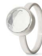
Ring Edelstahl Kristall Facettiert TB-RS-CRY-FC