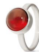
Ring Edelstahl Roter Achat TB-RS-AGR

Die Ringe von Tadblu bieten eine dezente und stilvolle Möglichkeit, die Erinnerungen an Ihren geliebten Menschen jederzeit und überall bei sich zu tragen. Gefertigt aus Edelstahl oder Gold und verziert mit sorgfältig polierten Edelsteinen, einschließlich glatter Steine oder Steine mit einer von zwei facettierten Ausführungen. Die Steine haben einen großzügigen Durchmesser von 10 mm.