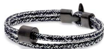
Nautisches Seil Jeans TB-BE-BC6