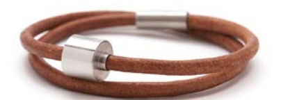
Glattes Leder Cognac TB-BL3