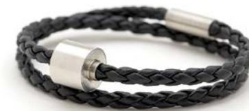
Geflochtenes Leder Schwarz TB-BB1