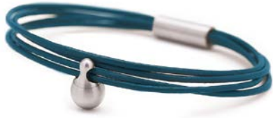
Charm-Armband Edelstahl Petrol TB-CL9