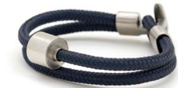
Nautisches Seil Marineblau TB-BC12