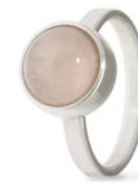
Ring Edelstahl Rosenquarz TB-RS-ROQ