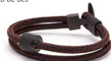
Nautisches Seil Braun & Marineblau TB-BE-BC5