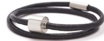
Glattes Leder Schwarz TB-BL1