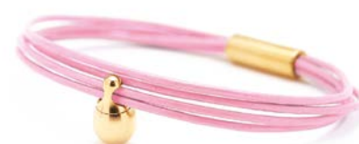
Charm-Armband Gold Rosa TB-CLG16