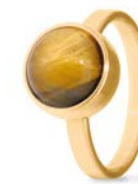
Ring Gold Tigerauge TB-RG-TEY