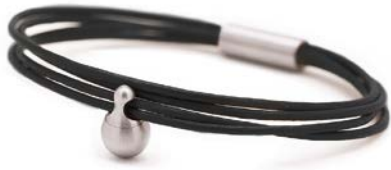
Charm-Armband Edelstahl Schwarz TB-CL1

Die Charm-Armbänder bieten eine elegante und zeitlose Möglichkeit, die Erinnerung an Ihre Lieben immer nah zu halten. Sie verfügen über einen tropfenförmigen Aschebehälter aus Edelstahl oder Gold, bestehen aus vier feinen Ledersträngen mit einem magnetischen Verschluss und passen müheless zu jedem Outfit.