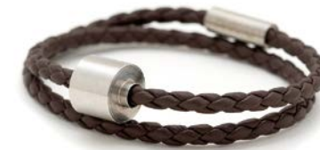
Geflochtenes Leder Braun TB-BB2