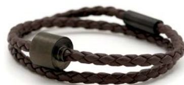
Geflochtenes Leder Braun TB-BE-BB2