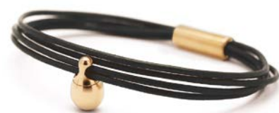
Charm-Armband Gold Schwarz TB-CLG1