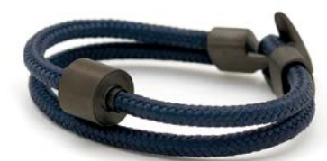
Nautisches Seil Marineblau TB-BE-BC12