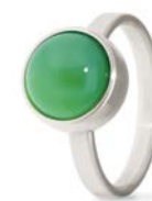
Ring Edelstahl Grüner Achat TB-RS-AGG