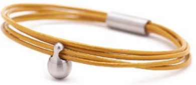
Charm-Armband Edelstahl Gelb TB-CL8