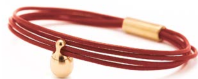
Charm-Armband Gold Rot TB-CLG15