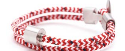
Nautisches Seil Rot & Weiß TB-BC8