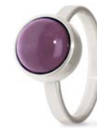
Ring Edelstahl Amethyst TB-RS-AMT