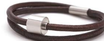
Glattes Leder Braun TB-BL2