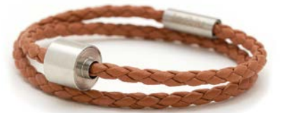
Geflochtenes Leder Cognac TB-BB3