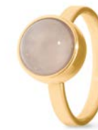
Ring Gold Rosenquarz TB-RG-ROQ