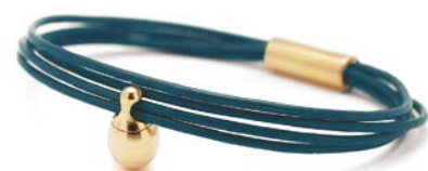
Charm-Armband Gold Petrol TB-CLG9