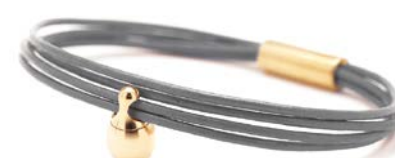
Charm-Armband Gold Grau TB-CLG14