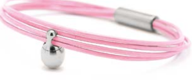
Charm-Armband Edelstahl Rosa TB-CL16