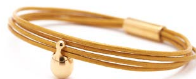
Charm-Armband Gold Gelb TB-CLG8