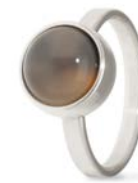
Ring Edelstahl Grauer Mondstein TB-RS-MOG