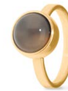
Ring Gold Grauer Mondstein TB-RG-MOG