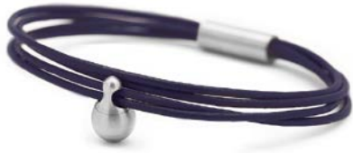
Charm-Armband Edelstahl Dunkelblau TB-CL12