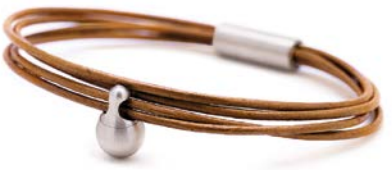
Charm-Armband Edelstahl Cognac TB-CL3