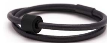
Glattes Leder Schwarz TB-BE-BL1