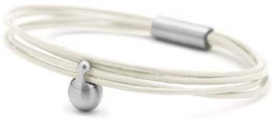
Charm-Armband Edelstahl Perle TB-CL10