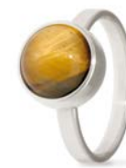
Ring Edelstahl Tigerauge TB-RS-TEY