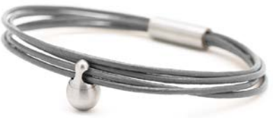
Charm-Armband Edelstahl Grau TB-CL14