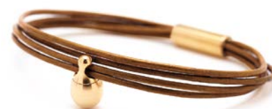
Charm-Armband Gold Cognac TB-CLG3