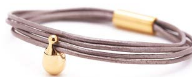
Charm-Armband Gold Auster TB-CLG13