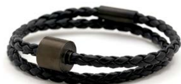
Geflochtenes Leder Schwarz TB-BE-BB1