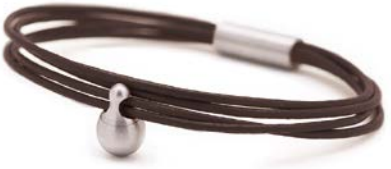
Charm-Armband Edelstahl Bronze TB-CL11