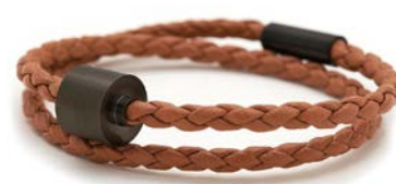
Geflochtenes Leder Cognac TB-BE-BB3