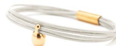
Charm-Armband Gold Perle TB-CLG10