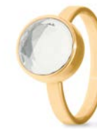
Ring Gold Kristall Facettiert TB-RG-CRY-FC