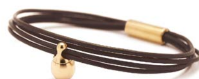
Charm-Armband Gold Bronze TB-CLG11