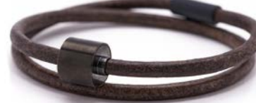
Glattes Leder Braun TB-BE-BL2