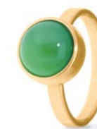
Ring Gold Grüner Achat TB-RG-AGG