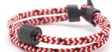
Nautisches Seil Rot & Weiß TB-BE-BC8