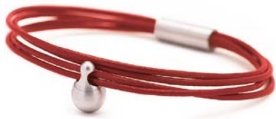
Charm-Armband Edelstahl Rot TB-CL15