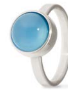
Ring Edelstahl Blauer Achat TB-RS-AGB