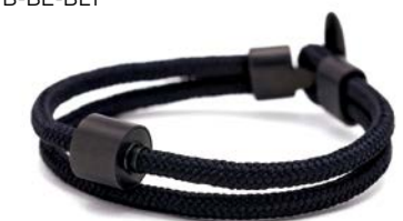
Nautisches Seil Schwarz TB-BE-BC1