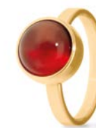
Ring Gold Roter Achat TB-RG-AGR