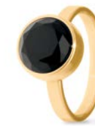
Ring Gold Schwarzer Onyx Facettiert TB-RG-ONB-FC